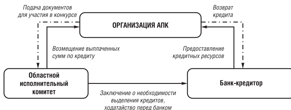
Рис. 3. Схема возмещения основного долга и процентов по кредиту организациям АПК

Важным моментом является то, что в предлагаемом механизме риски по реализации проекта на начальном этапе несет сама организация. Возмещение затрат по обслуживанию долга возможно только в том случае, если на отраженные в договоре с исполкомом даты, организация выполнила запланированный объем работ, достигла поставленных целей. Для этого следует предусмотреть заключение договора между организацией и исполкомом (рис. 3).