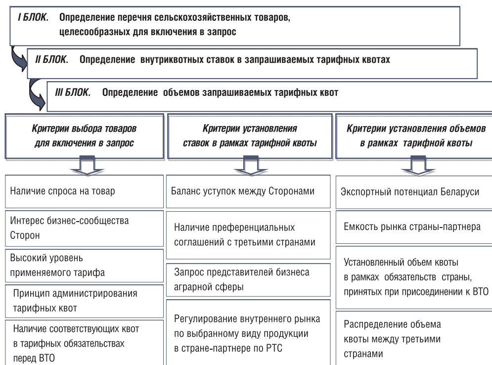
Рис. 3. Методика формирования запросов тарифных квот

Вместе с тем, как показывает практика, одним из наиболее реальных способов получения более либерального режима доступа на рынок по отдельным базовым сельскохозяйственным товарам при заключении соглашения о дву- и многосторонней торговле является применение тарифных квот. Формирование запросов квот, в том числе перечень и объемные показатели, в страны-партнеры по региональной интеграции является составной частью стратегии Беларуси при