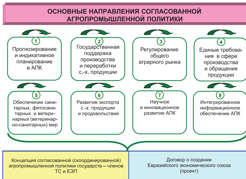
Рис. 2. Основные направления согласованной агропромышленной политики государств – членов ЕАЭС

Отправной точкой согласованных действий государств – членов сообщества станет сотрудничество в сфере прогнозирования . Прогнозы будут формироваться на базе балансов спроса