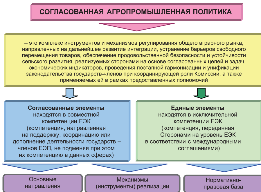
Рис. 1. Концептуальные подходы формирования согласованной агропромышленной политики стран ТС и ЕЭП