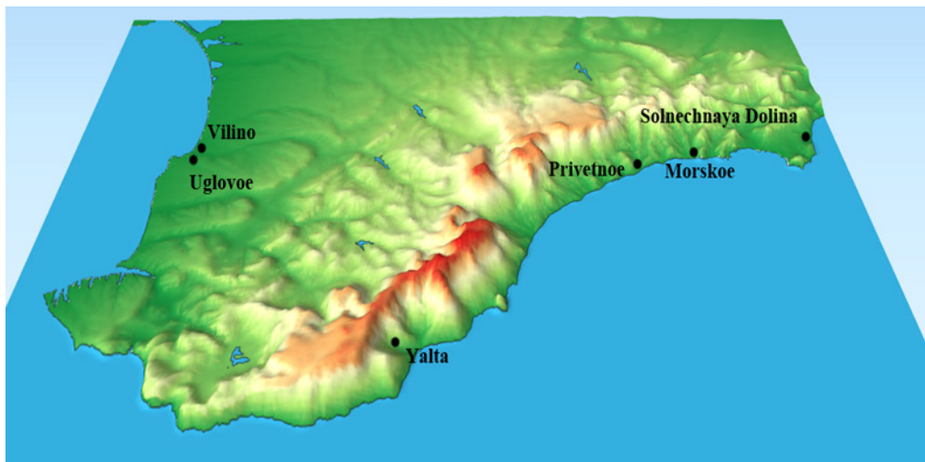
Рис. 1. Фрагмент цифровой карты рельефа Крымского полуострова и расположение анализируемых виноградников сорта Каберне Совиньон