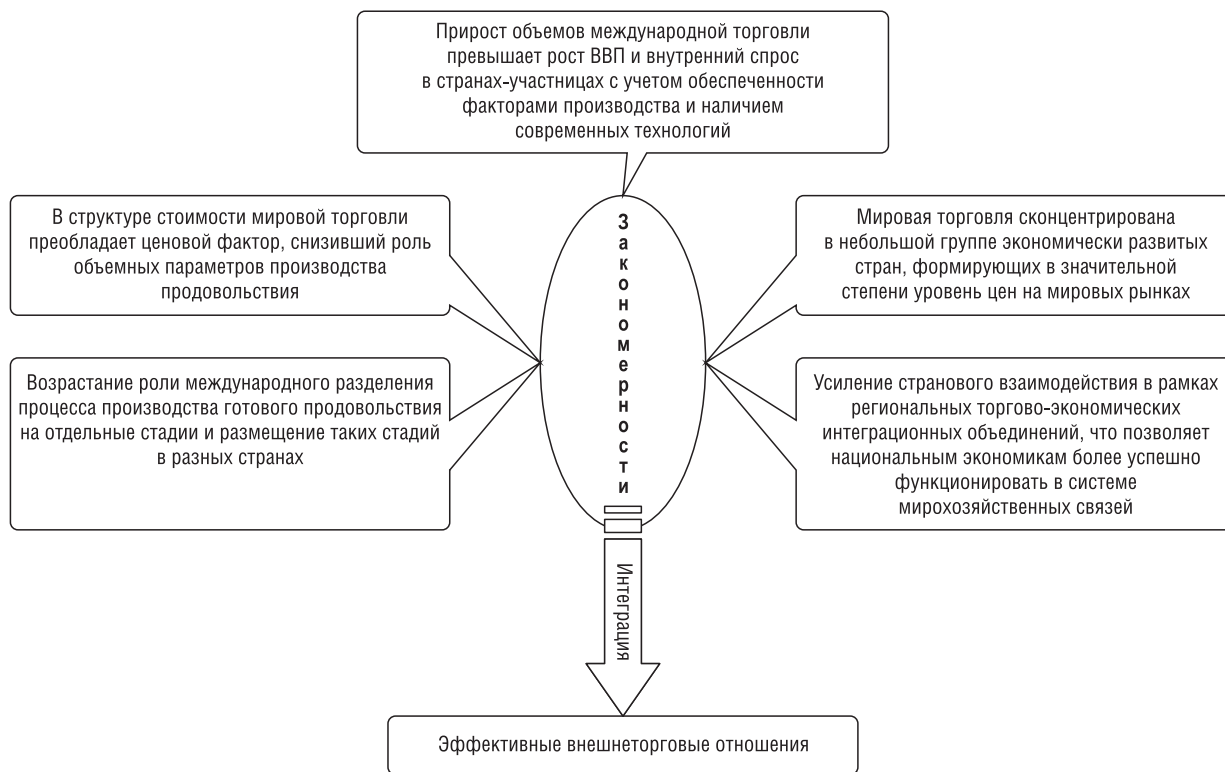
Рис. 3. Закономерности, обеспечивающие эффективные внешнеторговые отношения между странами в условиях региональной интеграции