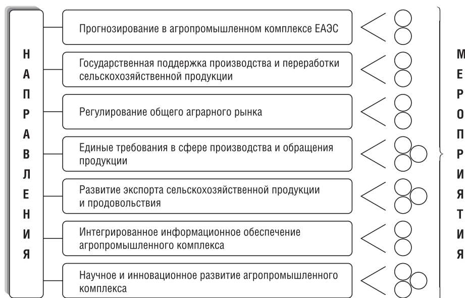
Рис. 1. Основные направления и мероприятия по реализации Концепции согласованной (скоординированной) агропромышленной политики государств – членов ЕАЭС

Реализация концептуальных подходов агропромышленной политики в ЕАЭС предусматривает согласованность и координацию действий государств-членов в соответствующих сферах (рис. 1).