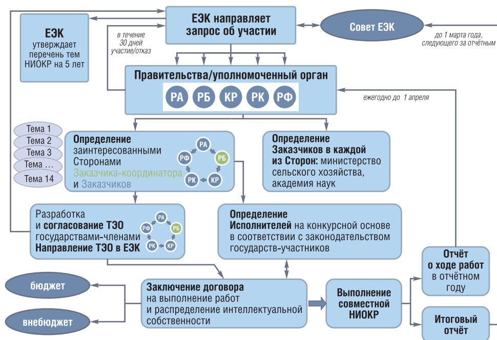
Рис. 2. Порядок организации совместных научно-исследовательских и опытно-конструкторских работ в сфере АПК государств – членов ЕАЭС

В данной связи Евразийским межправительственным советом утвержден Порядок организации совместных НИОКР в АПК (рис. 2). В данном документе установлены требования, функции и ответственность заказчиков и координаторов, источники и схемы финансирования. Указанные документы формируют основу для кооперации в научно-инновационной и производственной