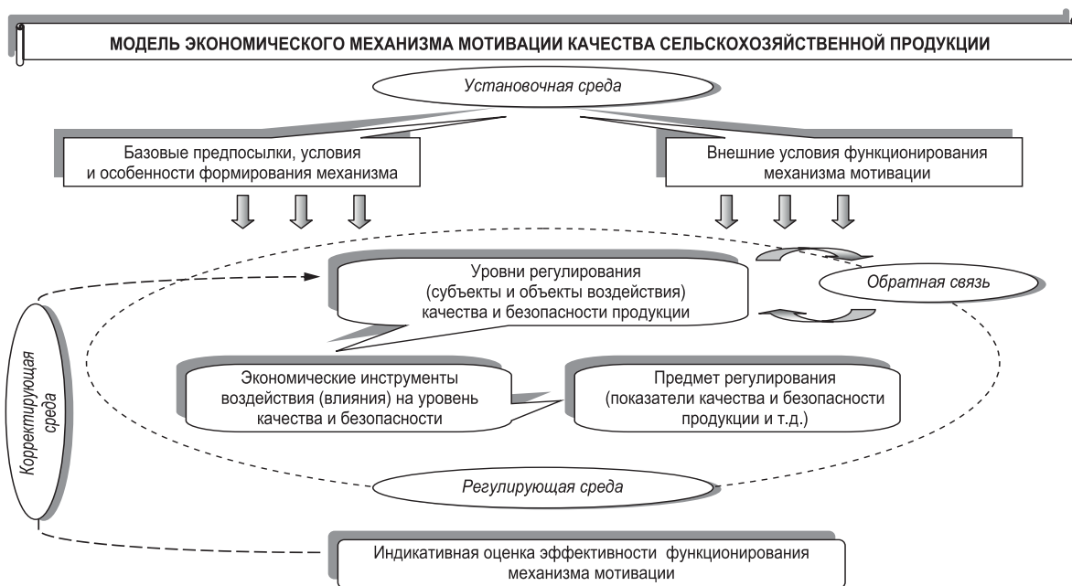
Рис. 3. Принципиальная модель экономического механизма мотивации качества продукции

Модель экономического механизма мотивации качества сельскохозяйственной продукции. На основе результатов проведенных исследований разработана соответствующая модель (рис. 3).